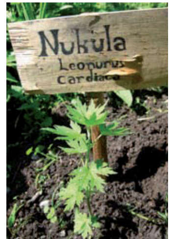
Nukula on itänyt Seura- saaren viljelypalstalla. Museoympäristössä kasvien nimet voidaan kirjoittaa päreeseen.